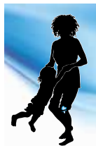
Fun with kids Knee