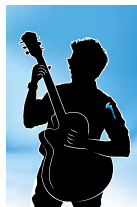
Playing guitar Extremities